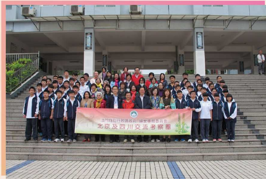
考察團成員與寶輪中學的學生於學校廣場合照

在四川期間，考察團拜訪了四川省婦女聯合會、成都市婦女兒童中心及廣元市文化藝術中心婦女文化素質培訓工程。可以發現四川受歷史有第一位女皇帝(武則天)的影響，當地婦女的地位不弱，尤其廣元市政府於每年9月1日更設有“女兒節”，每年都會舉行大型活動慶祝，所以這些機構轄下的服務中心都積極帶領婦女參與經濟