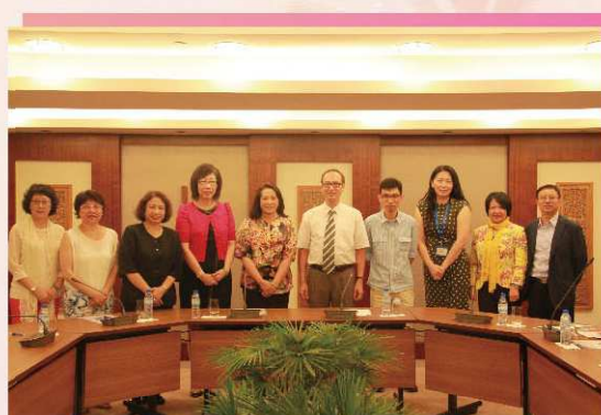
與高教辦代表就資料庫事宜交換意見