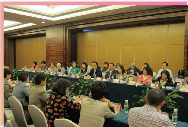
婦委會成員與廣元市婦聯代表就婦女工作進行交流

婦委會成員亦有前往考察澳門特區支持四川地震災後對廣元市進行的援建項目，包括婦女兒童之家、敬老院、澳門愛心民居、中學校及體育中心等。在婦女之家大家能看到當地婦女在社群生活的凝聚力及精神面貌是積極的；利州區敬老院在災後重建了足夠的場所讓長者生活，為發揮長者的潛能及興趣，會鼓勵他們參加義工及興趣班；澳門愛心民居在基礎設施建設上配套完善，正積極結合紫蘭湖開發旅遊區；寶輪中學的學生亦發奮圖強，在比賽上奪得多個榮譽獎項。當地居民對澳門同胞伸出的援助感恩甚深，婦委會一行對當地居民災後的生活環境得到改善亦感到欣慰，期望今後友誼及交流得以延續，進一步推動婦女事務的進步與發展。