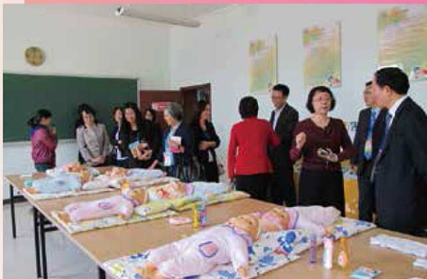
婦委會一行成員參觀北京市婦女兒童社會服務中心的設施，並與機構代表交流

在參觀婦女服務機構中，代表們分別詳細介紹社區中心的多元化服務以及活動成效，當中有些機構除了為有需要的家庭及婦女提供家庭教育外，還會為他們進行家政人員配對。這些交流考察經驗讓委員們對婦女服務的項目有更多的啟發，加強了社區服務對家庭支援的重要性，認為多元化的拓展有利提升婦女的綜合生活水平。