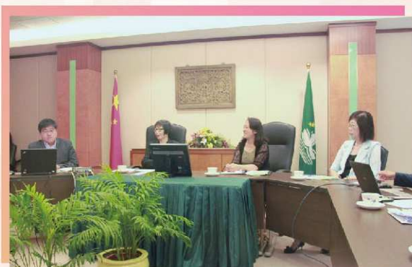
教育暨青年局代表接見婦委會成員，雙方就數據資料庫事宜作出交流

為使澳門婦女數據資料庫內的資料具有多元性、時效性及準確性，實有賴於各政府部門的支持及配合。為此本委員會日前已先後到統計暨普查局、衛生局、教育暨青年局、高等教育輔助辦公室及人力資源辦公室進行拜訪，且已獲得各部門的寶貴意見，承諾就相關數據資料事宜提供協助與配合。婦委會深信澳門婦女數據資料庫的籌設工作在各部門的協助下必定能順利進行，並取得預期的效果。