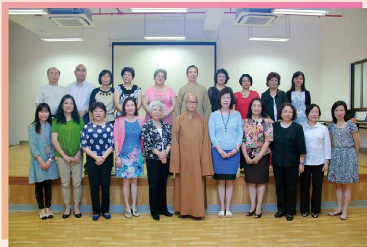
婦女事務委員會與菩提長者綜合服務中心負責人及代表合照

安排，現時已有80多名長者入住，未來將積極拓展及宣傳有關服務，滿足市民對長者服務的需求；拜訪期間，負責人帶領婦委會成員參觀中心的環境，委員們認為院舍的服務設施一應俱全，青少年及家庭的娛樂活動也符合大眾的興趣及品味，對該中心長幼共融的承辦構思表示認同。