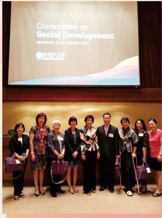
部份婦委會成員與聯合國亞洲及太平洋經濟(亞太經)社會委員會成員合照