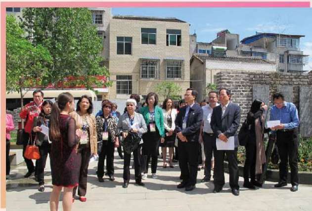
考察團成員到廣元參觀賑災後的援建項目