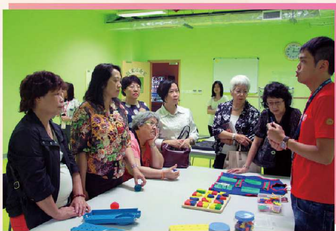
物理治療師為一眾委員仔細講解治療輔助用具的用途

菩提長者綜合服務中心是一所為長者、身體機能受損人士提供照護服務，並設有青少年與家庭服務的大樓，自去年11月開始營運，是本澳規模最大的長者綜合服務設施，有297個住宿牀位提供，可為失智症患者及有需要的長者提供日間照顧及復健治療。負責人表示，所有申請者均需由社會工作局的統一評估後才安排入住，同時可因應入住者的不同情況提供照護