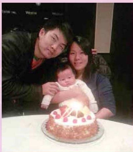
(張氏夫婦、一歲半大的兒子)

的基礎，是社會的縮影。因此，和睦家庭的意義，不僅關聯著每個人的幸福與追求，而且關聯著社會的穩定與發展。為了更瞭解現時本澳各樣家庭的生活現狀，本文採訪了幾對夫婦，分別是年輕、中年、老年這三個年齡層的夫婦，分享了他們夫妻相處之道，對家庭價值觀，以及構建和睦家庭的方法。