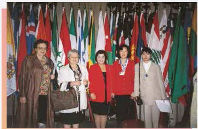
楊秀雯與澳葡政府時期的政務司安娜·庇利絲一同出席第四次世界婦女大會

楊秀雯憶起於1995年組織澳門婦女代表團赴京出席第四次世婦會時，經費出現困難，於是向政府申請資助，當時的社會事務政務司安娜·庇利絲在聽取楊秀雯陳述有關情況之後，馬上批出資助，還在會議上發言，是首次澳葡政府大力支持民間社團的活動，令楊姨十分感動和興奮。回歸後，婦聯繼續得到澳門特區政府的支持，每年派出代表參與聯合國的會議。