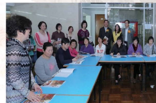
張裕司長、容光耀局長及婦委會一眾委員觀摩工作坊教學。