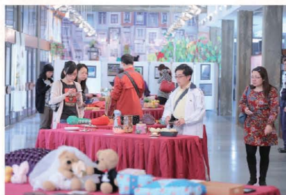
市民參觀手工藝製品展覽區。