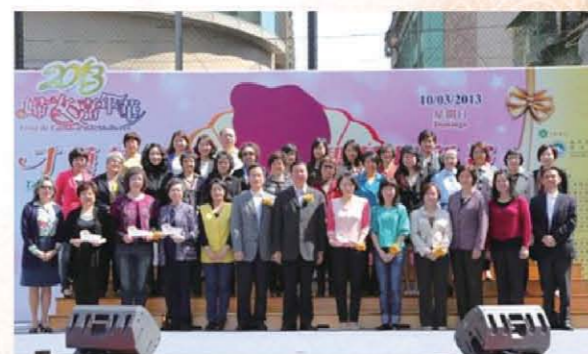
婦委會成員與活動協辦單位代表合照。

為向大眾展現本澳婦女多才多藝、八面玲瓏的面貌，婦女事務委員會於3月10日假葡文學校舉行「2013婦女嘉年華」活動，現場設有舞台表演、手工藝品展覽及才藝工作坊。本年大會口號為「才藝若瑰寶·智慧展新姿」，展示本澳婦女多方面的藝術才華，體現不同年齡階層婦女的文化創造力。婦委會期望澳門特區婦女繼續多學習、多參與、多發表意見，不斷自我提升，獻出婦女半邊天的智慧與力量，讓社會見證新時代女性的特質。